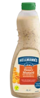
Med a horčica 1 l