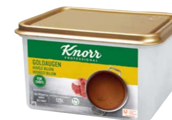
Goldaugen – Hovädzí bujón 3 kg Počet porcií: 500

Goldaugen (známa receptúra „so zlatými očkami“) je zárukou bujónu so silnou vôňou a chuťou vývaru z hovädzieho mäsa. Ideálny na zosilnenie hovädzej chuti polievok, omáčok, štiav či jedál s hovädzím mäsom.