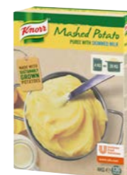
Zemiaková kaša s mliekom 4 kg Počet porcií: 130

Jemná zemiaková chuť a perfektná konzistencia, akoby ste prílohu pripravovali od základu. Ponúknite hosťom výbornú zemiakovú kašu.