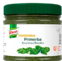
PRIMERBA Bazalka 340 g

Veľmi kvalitné pesty z voňavých bylín a zeleniny, ktoré boli šetrne spracované ihneď po zbere, bez konzervantov a prídavných farbív. Ideálne na prípravu studených aj teplých jedál.