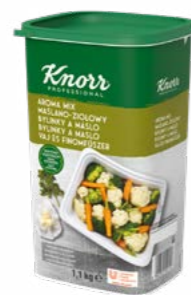
Aroma Mix Bylinky & Maslo 1,1 kg

Keď potrebujete ochutiť cestovinové, ryžové či zeleninové jedlá a dodať im niečo navyše. Jedlá potom počas uchovávaní v ohrevných nádobách nestratia svoju vlhkosť, chuť ani vôňu.