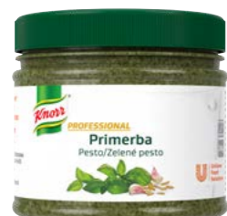
PRIMERBA Zelené pesto 340 g