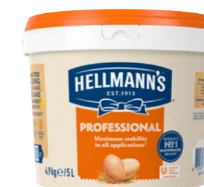
Majonéza Professional 5 l