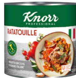
Ratatouille 2,5 kg