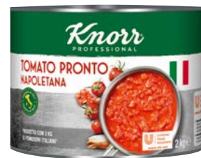
Tomato Pronto 2 kg