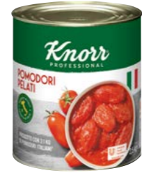
Pelati – Paradajky celé lúpané 2,5 kg