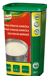
Jemná syrová omáčka 1,2 kg