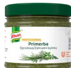
PRIMERBA Záhradné bylinky 340 g