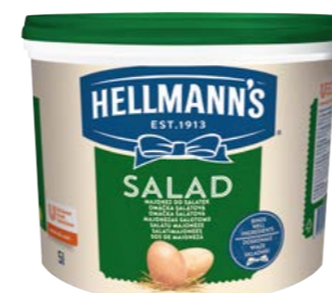
Salad 5 l

Jemné, z kvalitných ingrediencií a s nezameniteľnou chuťou Hellmann's – presne také sú naše majonézy. To pravé na prípravu dipov, studených omáčok, šalátov alebo obložených vaječ.