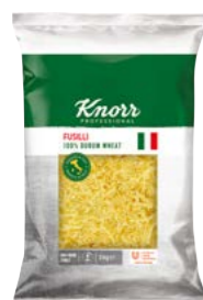
Fusilli 3 kg