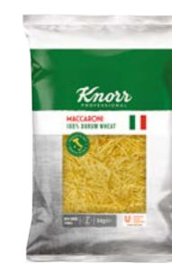
Polievkové rezance 3 kg