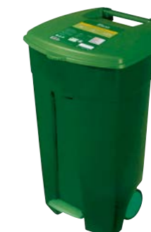
Číry bujón 60 kg