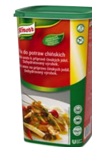
Fix do čínskych jedál 1 kg