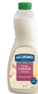
Caesar 1 l