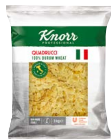
Quadrucci – fličky 3 kg

Priamo zo slnečného Talianska pre vás dovážame kvalitné semolinové cestoviny, ktoré neobsahujú pridané vajcia. Vyberte si zo širokej ponuky tvarov a veľkostí na každú príležitosť.