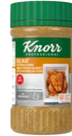
Delikát korenie na hydinu 600 g

Koreniace prípravky Knorr sú vhodné do teplej, ale aj studenej kuchyne. Originálne kombinujú chuť a vôňu vybraných bylín, zeleniny a korenia.