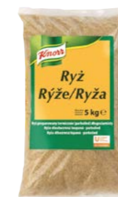
Ryža dlhozrnná parboiled 5 kg Počet porcií: 71

S dlhozrnnou ryžou parboiled dosiahnete vždy rovnako dobrú a sypkú konzistenciu. Klasická príloha k mäsám, aj ako základ ďalších ryžových variácií.