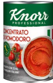
Paradajkový pretlak 4,5 kg

Špičková kvalita dostupná počas celého roku, to sú zeleninové zmesi z veľmi kvalitnej zeleniny privezenej priamo z Talianska. Špeciálne ochutené zmesi Knorr splňajú tie najvyššie nároky.