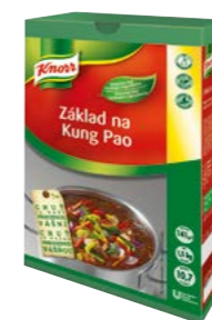
Základ na Kung Pao 1,5 kg

Ako jednoducho dosiahnuť vynikajúcu chuť, či už sa pustíte do klasiky alebo medzinárodnej kuchyne? Uľahčite si prácu kvalitnými základmi Knorr. Sú vhodné aj na zapekanie.