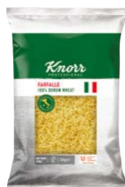
Farfalle 3 kg