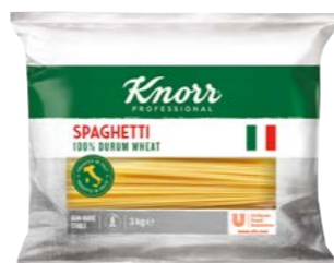
Spaghetti 3 kg