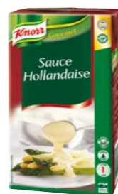
Holandská omáčka tekutá 1 l