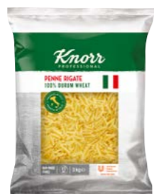
Penne 3 kg