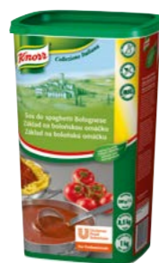
Základ na bolonskú omáčku 1 kg

S prémiovými talianskymi omáčkami Knorr vyčarujete za okamih to pravé Taliansko. Perfektné k všetkým druhom cestovín, na gnocchi, tortellini aj ravioly, k hydínovému, teľaciemu a všetkým mletým mäsám.