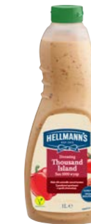
Tisíc ostrovov 1 l