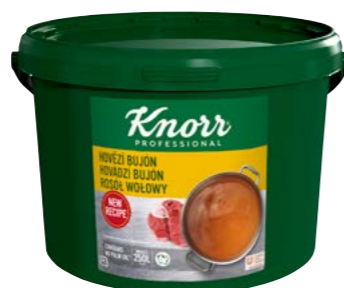
Hovädzí bujón 5 kg