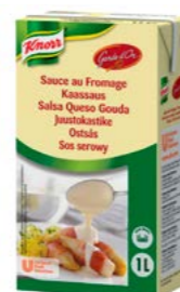
Garde d'Or Sirová omáčka 1 kg