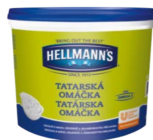
Tatárska omáčka 10 l