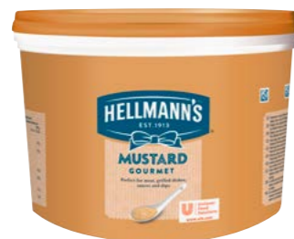
Horčica 3 kg

Horčice Hellmann's sú skvelý doplnok k akémukoľvek grilovanému mäsu či klobáse, osvedčia sa tiež ako základ pre rôzne variácie horčičných dipov, dresingov a studených omáčok.