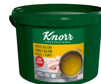
Kurací bujón 5 kg Počet porcií: 1 000