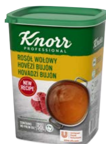
Hovädzí bujón 1 kg

Číre bujóny so silnou chuťou a vôňou vývaru z hovädzieho mäsa sú vhodné na posilnenie hovädzej chute v celom rade jedál: od polievok, omáčok, štiav a mariád až napríklad po kôprovú omáčku. Bujóny sú bez alergénov (bez lepku a laktózy) a bez palmového oleja.