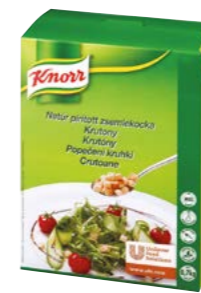
Polievkové krutóny 700 g

Vynikajúco chutia a na tanieri vyzerajú veľmi lákavo. Závarky do polievok Knorr sú skrátka pohotovú doplnok vhodný nielen do vašich čírych a krémových polievok.