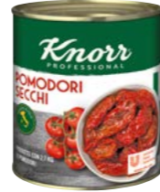
Sušené paradajky 0,75 kg