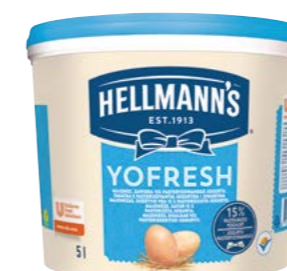
Yofresh 5 l