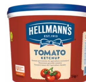
Kečup 5 kg

Kečupy s príjemne sladkokyslou chuťou sa hodia k celému radu jedál. Vďaka špeciálnemu porciovanému baleniu a unikátnemu systému dávkovania je zaručený vysoký stupeň hygieny.