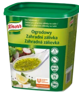
Záhradná zálievka 700 g Výdatnosť: 7 l

Spestríte svoju ponuku šalátov zálievkou Knorr. Vďaka stabilnej konzistencii sa jednotlivé zložky neoddeľujú ani po niekoľkých hodinách, zálievka je tak vhodná aj na prípravu šalátových bufetov.