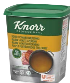
Knorr Professional Bujón s chuťou údeného 1 kg

Naozaj silný bujón s chuťou a vôňou údeného mäsa, cibulou a cesnakom. Perfektný na zosilnenie chuti údeného mäsa, alebo na dochutenie zemiakovej kaše.