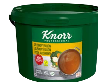
Zeleninový bujón 5 kg