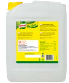
Delikát tekutý 5 l