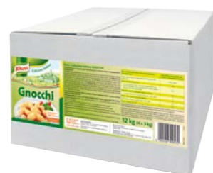
Gnocchi 12 kg