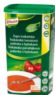
Toskánska paradajková polievka s bylinkami 1,2 kg