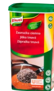
Tmavá zápražka 1 kg