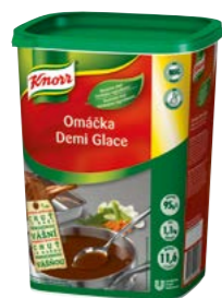
Demi Glace 1,1 kg

Minútkové omáčky Knorr sú skvelým riešením pre vaše menu. Vždy rovnako kvalitné, so správnou konzistenciou a perfektnou chuťou aj vôňou. Pre všetkých moderných a kreatívnych kuchárov.