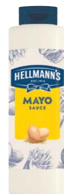
Majonézová omáčka 820 g