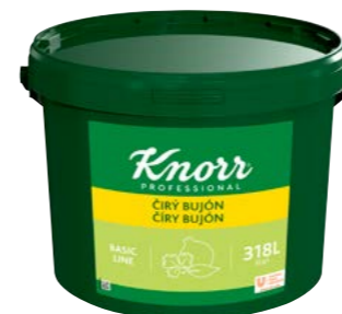
Číry bujón 7 kg

Skvelý univerzálny bujón obohatený sekanou petržlenovou vňaťou a ďalšími bylinkami. Vhodný do krémových polievok, omáčok, štiav a ďalších pokrmov, alebo na ochutenie vody pri varení vložiek a zavárok.