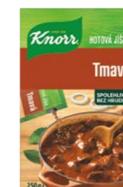
Zápražka tmavá 0,25 kg