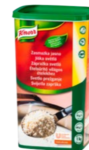
Svetlá zápražka 1 kg

Vďaka granulovej konzistencii sa okamžite rozpúšťajú a netvoria sa hrudky, takže nimi môžete jedlo zahustiť kedykoľvek počas varenia. Skrátka rýchly a spoľahlivý pomocník pre všetky prípady.