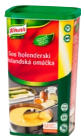
Holandská omáčka 1 kg