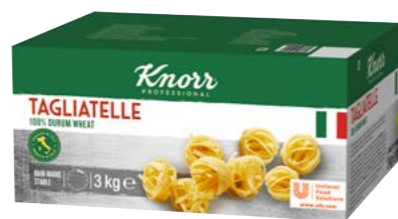
Tagliatelle 3 kg