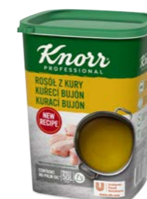
Kurací bujón 1 kg Počet porcií: 200

Číre zlatisté bujóny s typickou chuťou a vôňou kuracieho vývaru. Vhodné do polievok, omáčok, štiav, marinád, na ochutenie zeleninových a hydínových jedál. Bujóny sú bez alergénov (bez lepku a laktózy) a bez palmového oleja.