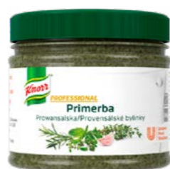
PRIMERBA Provencalské bylinky 340 g