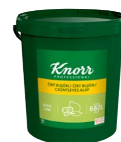
Číry bujón 15 kg