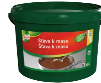
Šťava k mäsu 3,5 kg Výdatnosť: 35 l

Je použiteľná bez vlastnej úpravy alebo ako základ najrôznejších variácií štiav a oceníte ju hlavne pri príprave mäsa v konvektomate. Knorr šťava má skrátka šťavu!