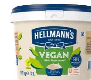
Vegan 2 l