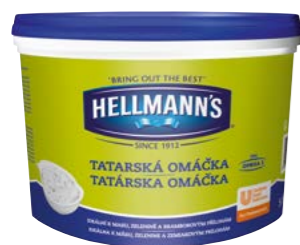
Tatárska omáčka 5 l

Obľúbená tatárska omáčka, na ktorej kvalitu a poctivú chuť sa môžete vy aj vaši zákazníci spoľahnúť. Máte na výber z veľkých aj praktických jednorporciových balení.