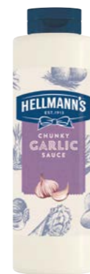
Cesneková omáčka 860 g