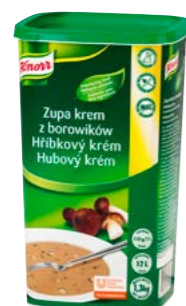
Hubový krém 1,3 kg

Z ponuky našich trendy zahustených polievok si určite vyberie každý, kto chce svojim zákazníkom na tanieri servírovať vždy iba to najlepšie.