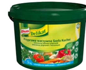
Delikát 5 kg