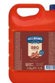
Barbecue omáčka 4,8 kg

Jedinečná kombinácia chutí, ktorá perfektne doplní grilované mäso a ďalšie dobroty z grilu. Stačí si vybrať Hellmann's Barbecue omáčku k mäsu a je to!