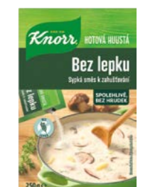
Huštá zátrepka bez lepku 0,25 kg