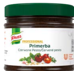
PRIMERBA Červené pesto 340 g