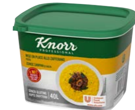
Šafranová pasta 800 g