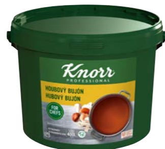
Hubový bujón 8 kg