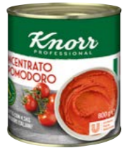
Paradajkový pretlak 0,8 kg