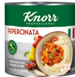
Peperonata 2,6 kg