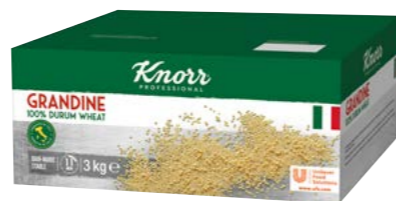
Grandine – Tarhoňa 3 kg