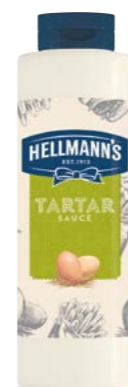
Tatárska omáčka 846 g