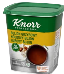
Hubový bujón 1 kg

Tmavý hubový bujón s chuťou a vôňou hřibov a šampiňónov je skvelý na zosilnenie chuti v hubových polievkach alebo omáčkach, priam vynikajúci je na dochutenie hubového rizota.