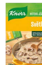
Zápražka svetlá 0,25 kg