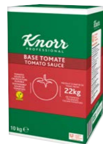
Paradajková omáčka 10 kg

Vyrobená v Taliansku z 22 kg paradajok, ktoré zreli na slnku. Paradajky sú udržateľne pestované. Obsahuje iba paradajky a morskú soľ.