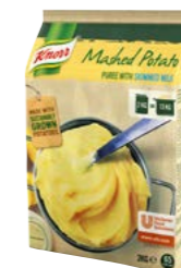
Zemiaková kaša s mliekom 4x 2 kg Počet porcií: 262