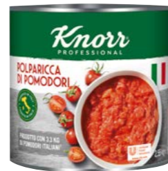
Polparicca – Krájané paradajky 2,55 kg