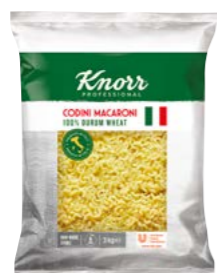
Codini – Kolínka 3 kg