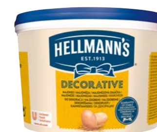
Majonéza Decorative 3 l