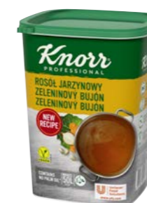
Zeleninový bujón 1 kg

Všestranne využiteľné bujóny s plnou a bohatou chuťou zeleniny aj jemného korenia, napr. kurkumu a bieleho korenia. Bujóny sú bez alergénov (bez lepku a laktózy) a bez palmového oleja. Vhodné pre vegánov.